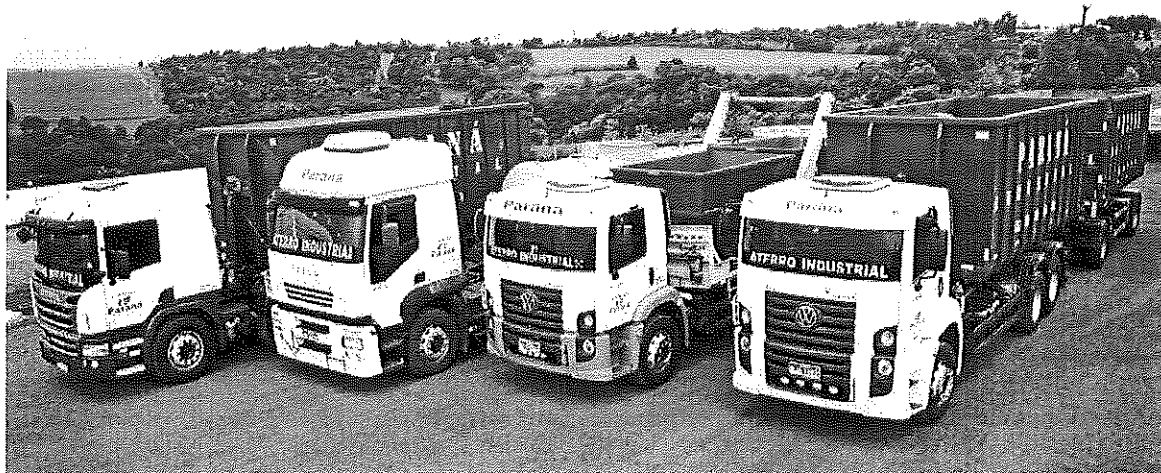
Imagem n.º 01 – Alguns equipamentos disponíveis

5 Condição de Pagamento: Conforme edital de contratação.